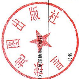
海南省中小学教材零售价格核定申请表